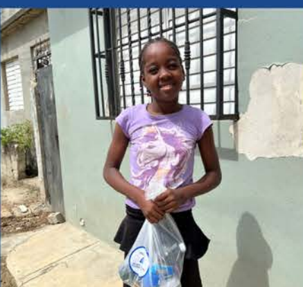
ENTREGAS RACIONES DE ALIMENTOS A LAS FAMILIAS VULNERABLES EN LAS COMUNIDADES LOCALES