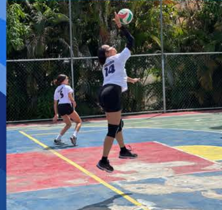
CLASES DE VOLEIBOL