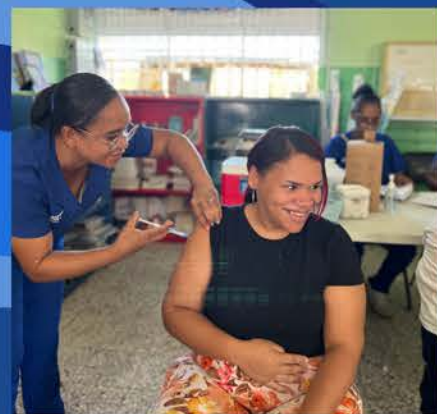
SERVICIOS FIJOS DE VACUNACIÓN PARA NIÑOS, NIÑAS Y ADULTOS