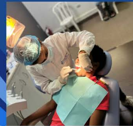
SERVICIOS FIJOS DE ODONTOLÓGIA