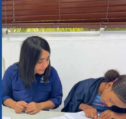
SERVICIOS FIJOS DE PSICOLOGÍA