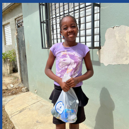
ENTREGAS DE RACIONES DE ALIMENTOS A LAS FAMILIAS VULNERABLES EN LAS COMUNIDADES LOCALES