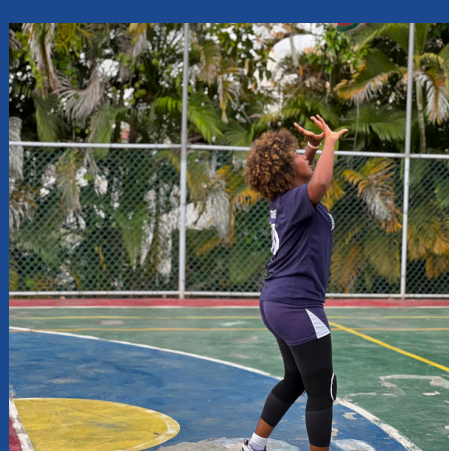
CLASES DE VOLEIBOL