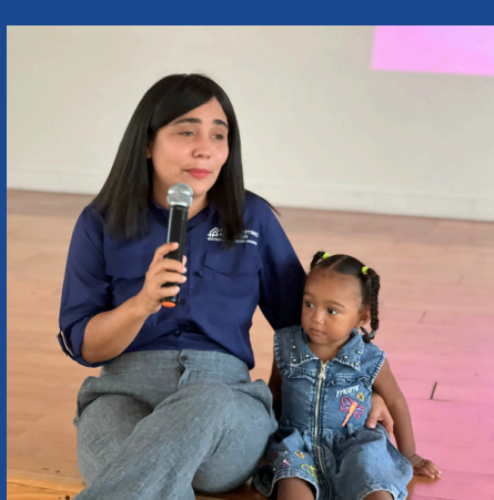
SERVICIOS FIJOS DE DE PSICOLOGÍA