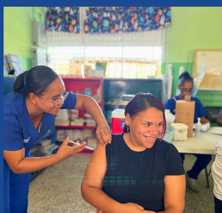
SERVICIOS FIJOS DE VACUNACIÓN PARA NIÑOS, NIÑAS Y ADULTOS