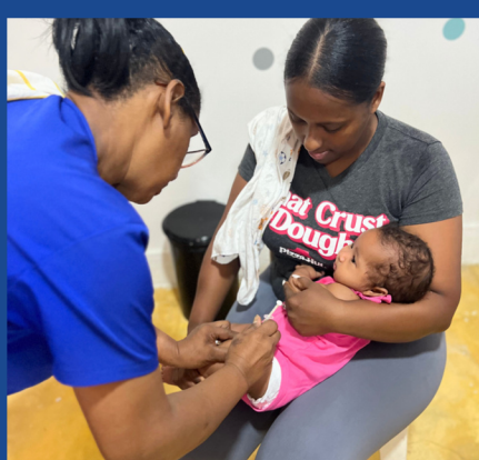
SERVICIOS FIJOS DE VACUNACIÓN PARA NIÑOS, NIÑAS Y ADULTOS