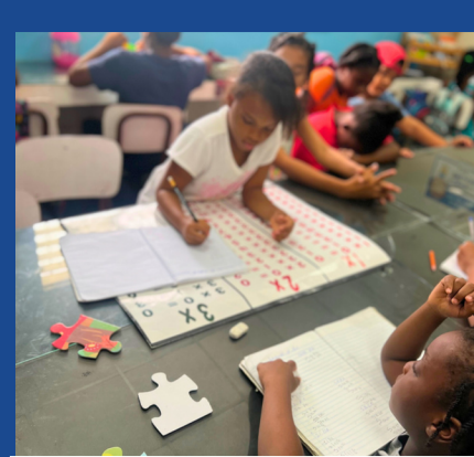
ESPACIO DE TAREAS PARA NIÑOS, NIÑAS Y ADOLESCENTES