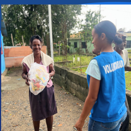
ENTREGAS RACIONES DE ALIMENTOS A LAS FAMILIAS VULNERABLES EN LAS COMUNIDADES LOCALES