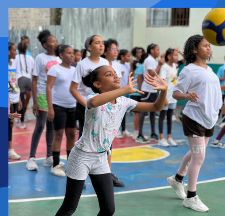
CLASES DE VOLEIBOL