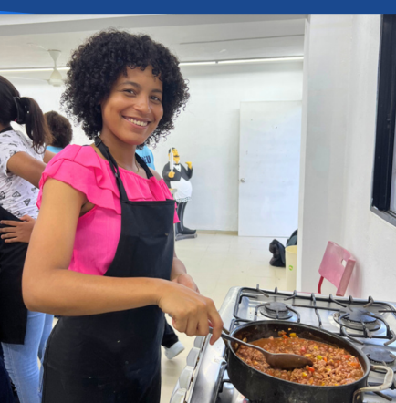
PROGRAMA DE HABILIDADES PARA LA VIDA.