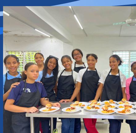
PROGRAMA DE HABILIDADES PARA LA VIDA.