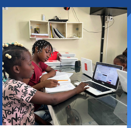
ESPACIO DE TAREAS PARA NIÑOS, NIÑAS Y ADOLESCENTES