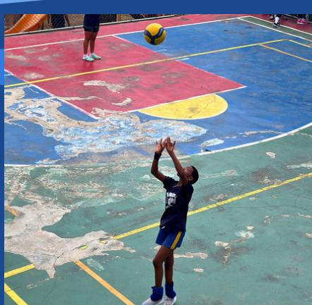
CLASES DE VOLEIBOL