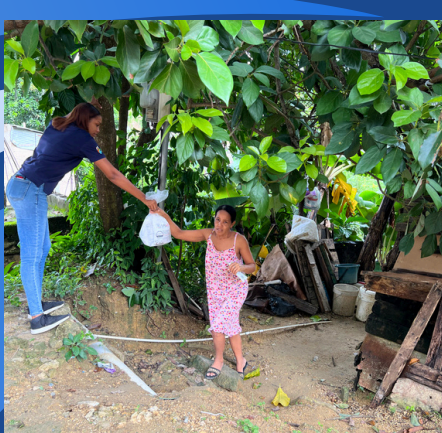
ENTREGAS RACIONES DE ALIMENTOS A LAS FAMILIAS VULNERABLES EN LAS COMUNIDADES LOCALES