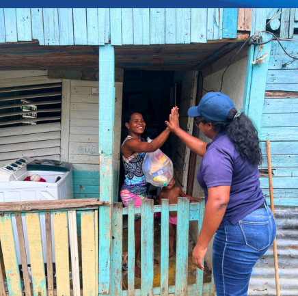
ENTREGAS RACIONES DE ALIMENTOS A LAS FAMILIAS VULNERABLES EN LAS COMUNIDADES LOCALES