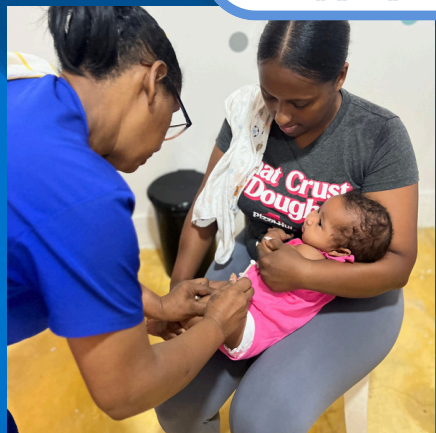
SERVICIOS FIJOS DE VACUNACIÓN PARA NIÑOS, NIÑAS Y ADULTOS