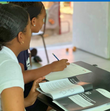
PROGRAMA DE HABILIDADES PARA LA VIDA.