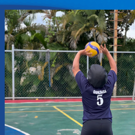
CLASES DE VOLEIBOL